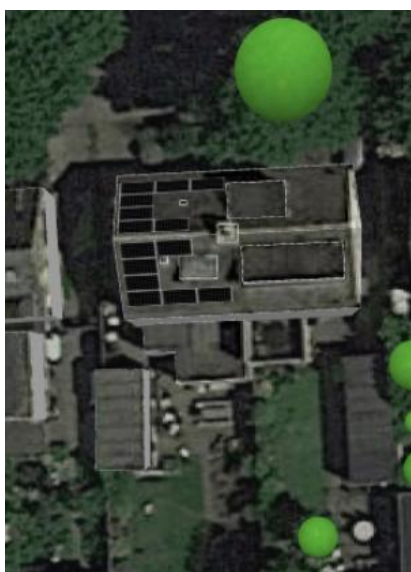
Figuur 3: Voorbeeld legplan 14 PVT-panelen