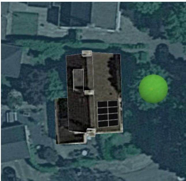
Figuur 3: Voorbeeld legplan 8 PVT-panelen