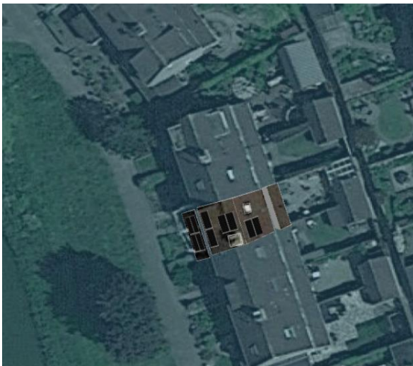
Figuur 3: Voorbeeld legplan 10 PVT-panelen