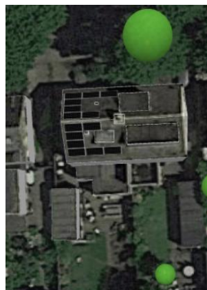
Voorbeeld legplan 9 PVT-panelen

Over 15 jaar ziet de vergelijking tussen verwarmen met aardgas versus all-electric er als volgt uit: