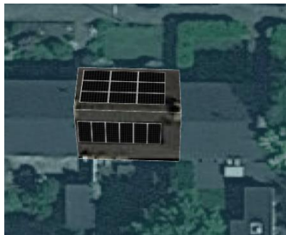
Voorbeeld legplan 9 PVT-panelen

Over 15 jaar ziet de vergelijking tussen verwarmen met aardgas versus all-electric er als volgt uit: