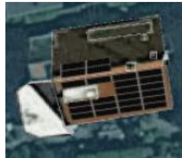
Voorbeeld legplan 10 PVT-panelen

Over 15 jaar ziet de vergelijking tussen verwarmen met aardgas versus all-electric er als volgt uit: